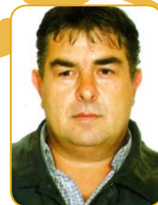
Fulgencio Banderas Rodríguez Concejal de Obras y Urbanismo