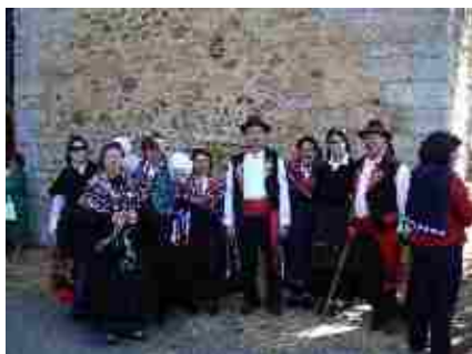
Distintos momentos de la romería.