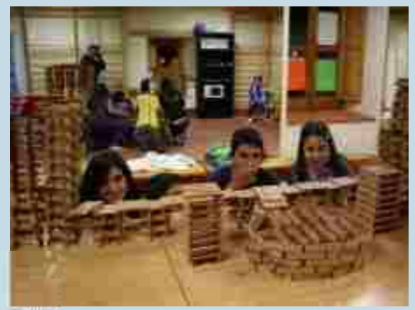
Taller de figuras de madera.