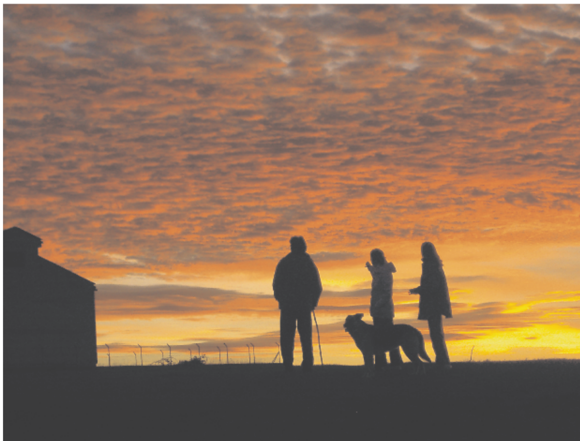
1 er premio. Isidro Oblanca

Estas son las fotografías Ganadoras del concurso de este año