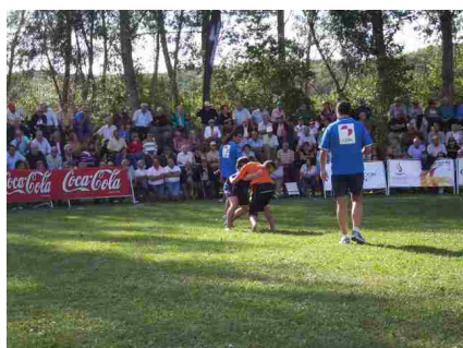
Corro de aluches.