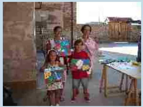
Taller de pasta de papel.